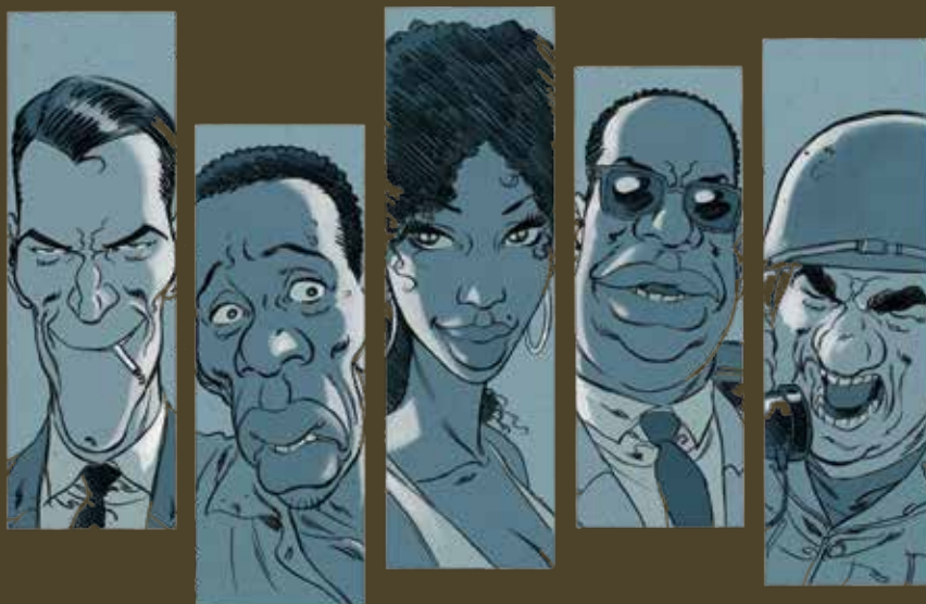
© 2017 by DARGAUD EDITEUR - PARIS

Katanga gaat niet over reële personages. Het is ook geen puur historisch verhaal zoals De dood van Stalin . Instinctief leek het ons beter om Katanga als een politieke thriller