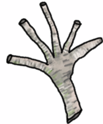
□ EEN HAND