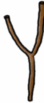
□ DE LETTER Y