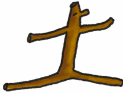
□ SPRINGENDE BALLERINA / O