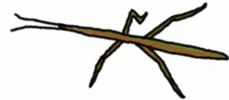
□ WANDELENDE TAK